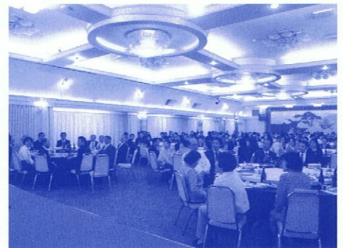
172名もの参加で例年通り賑わった懇親会