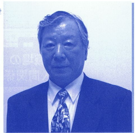
朝倉介護保険事業者協議会 会長

任された任期を、地域のお役に立つように務めて参りますので、諸先輩方及び各関係者の皆様方のご協力並びに、ご支援の程宜しく願い申し上げ、ご挨拶と致します。