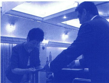
認知症サポーター支援活動の功労者表彰