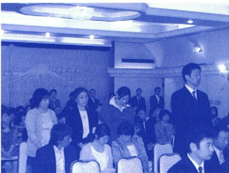
真剣な表情で総会に臨む新部会長の皆さん

本年度は、役員・各専門部会長等の交代を含む転換期でもあり、新体制に向けて、協議会運営の円滑化を目的とした顧問の設置や今年度の事業計画等が発表され、満場一致をもって可決されたほか、昨年度に引き続き、認知症サポーター支援活動における功労者への表彰も行われた。