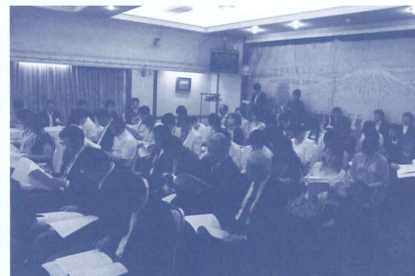
事務局の説明を聞く皆さん