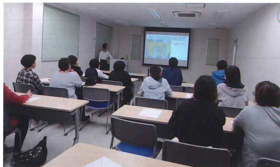
外部講師による研修の様子

今後はサービス向上のために、各事業所との連携、情報提供や意見交換をより密にできるようにしたいと思っております。