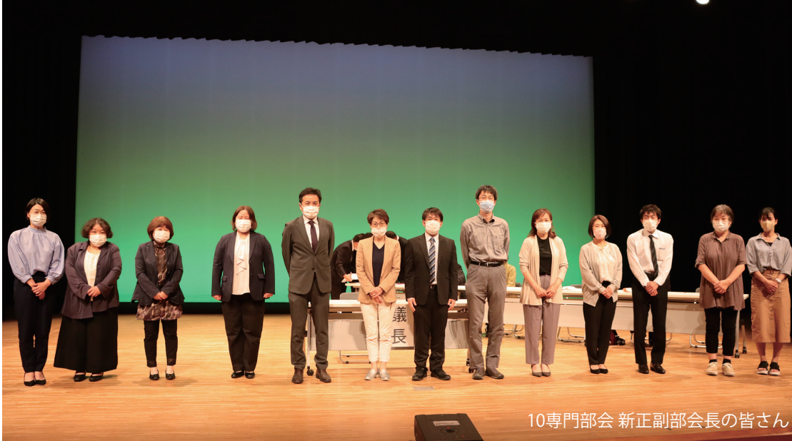
10専門部会 新正副部会長の皆さん