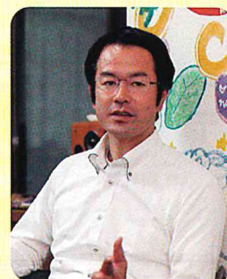
医療法人静光園 白川病院 医療連携室長