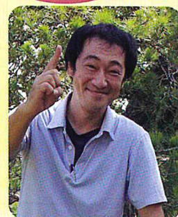
小規模多機能型居宅介護つっ お管理者