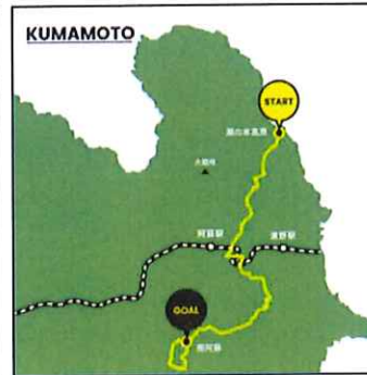
【熊本阿蘇ステージ】