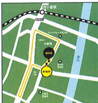
【小倉城クリテリウム】