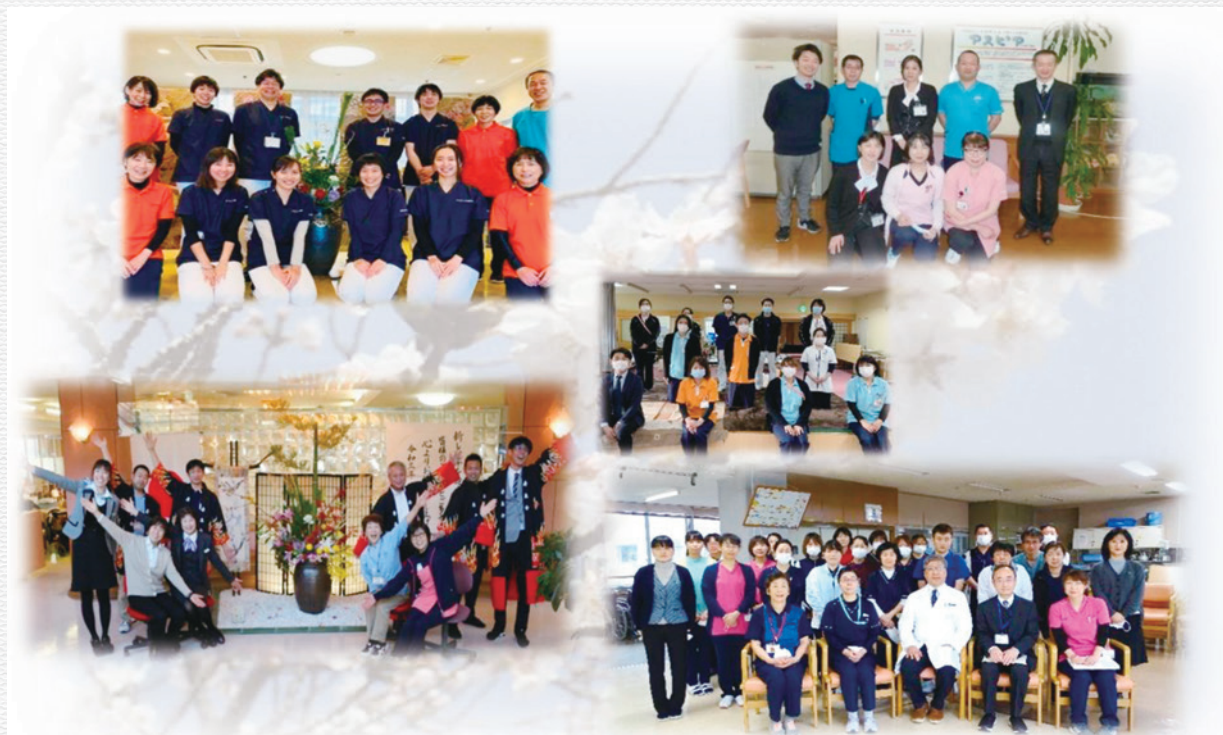
一般社団法人 朝倉医師会アスピア

介護老人保健施設部会は現在6施設で活動を行っております。活動内容としては、施設間での情報共有を目的に、職種別部会の開催や部会勉強会・あさくら食文化を学ぶ会などを開催しております。会員間の交流と介護保険サービスの質の向上に向けた研鑽等の取り組みを行うとともに、各関係機関との連携を図りつつ円滑な介護保険サービスの提供を行って参りたいと思っております。